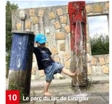
10 Le parc du lac de Linzgau