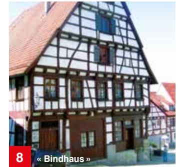
8 « Bindhaus »