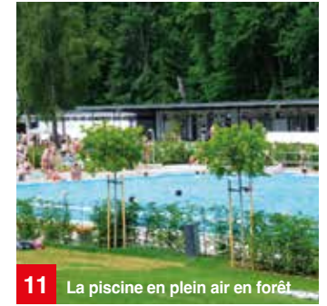
11 La piscine en plein air en forêt