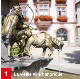
1 La vieille ville historique