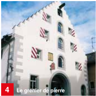
4 Le grenier de pierre