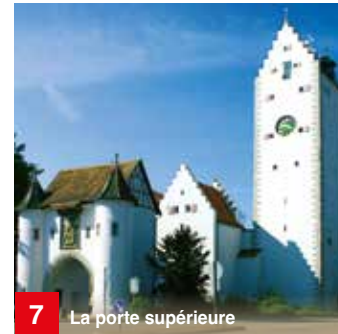
7 La porte supérieure