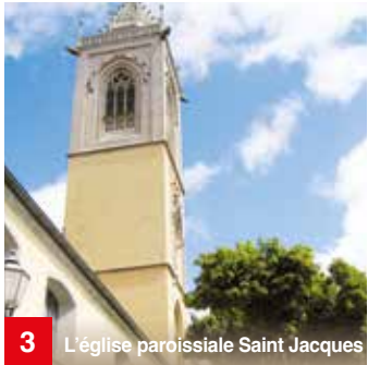
3 L'église paroissiale Saint Jacques