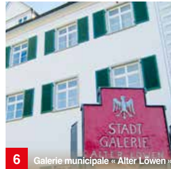
6 Galerie municipale « Alter Löwen »