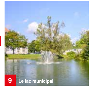
9 Le lac municipal