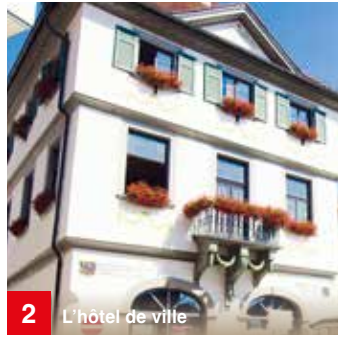
2 L'hôtel de ville