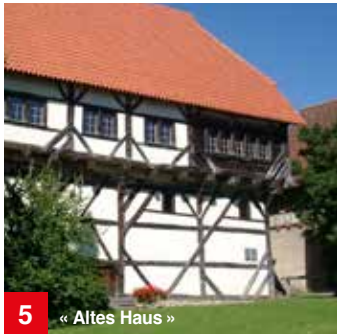
5 « Altes Haus »