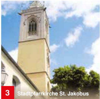
3 Stadtpfarrkirche St. Jakobus