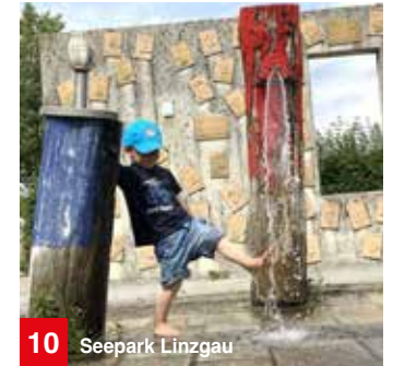
10 Seepark Linzgau