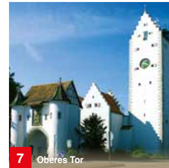
7 Oberes Tor