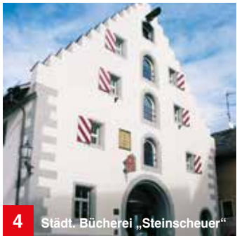
4 Städt. Bücherei „Steinscheuer“