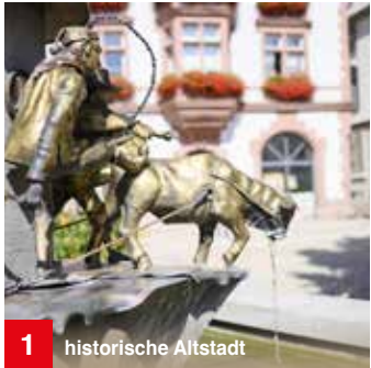
1 historische Altstadt