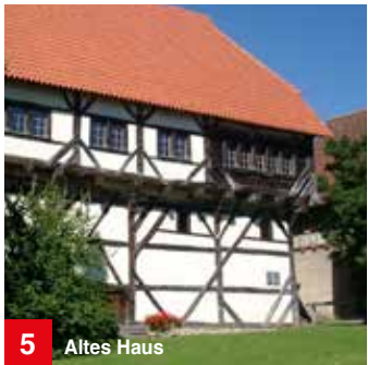
5 Altes Haus