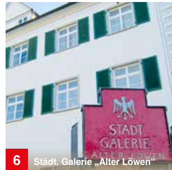
6 Städt. Galerie „Alter Löwen“