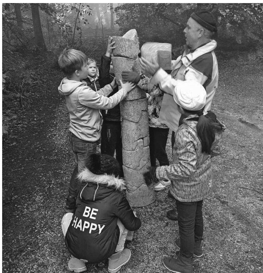
Auf unterhaltsame und kindgerechte Art erfuhren die Drittklässler bei den Waldjugendspielen viel Interessantes über den Wald, die Natur und die Umwelt.

Beckenboden in Balance mit der Feldenkrais-Methode!, 14 – 18 Uhr, 1