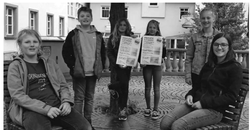
Die Jugend des DAV sammelte Daunen, die nach der Aufbereitung in neuen Kleidungsstücken wiederverwendet werden.

Pfullendorf/pa - Die Katholische Frauengemeinschaft Pfullendorf lädt am Dienstag, 29. Oktober, zum Jahresausflug ein. Er führt in die ehe-