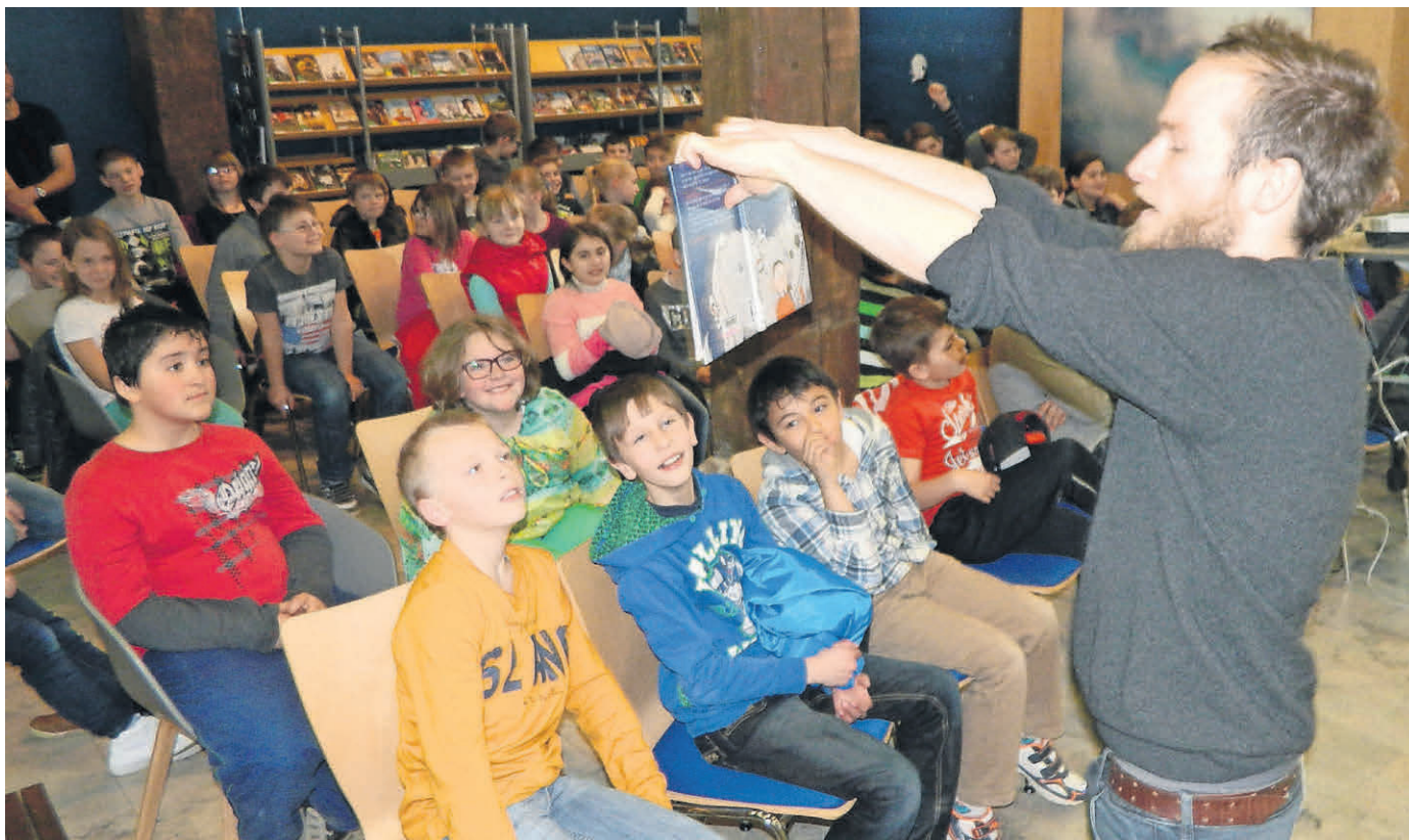
Die Stadtbücherei in der Steinscheuer lädt regelmäßig zu kulturellen Veranstaltungen ein. Ein besonderes Augenmerk wird dabei auf das Angebot für Kinder und Jugendliche gelegt. Auch jetzt im Oktober gibt es wieder eine Reihe attraktiver Veranstaltungen für kleine und große Bücher- und Literaturfreunde

Amtliches Mitteilungsblatt der Stadt Pfullendorf und ihrer Stadtteile Aach-Linz, Denkingen, Gaisweiler, Großstadelhofen, Mottschieß, Otterswang, Zell a. A.