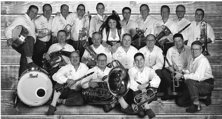
Der Musikverein Ach-Linz lädt zum Herbstfest der Blasmusik ein. Mit dabei ist auch die Blaskapelle Peng.