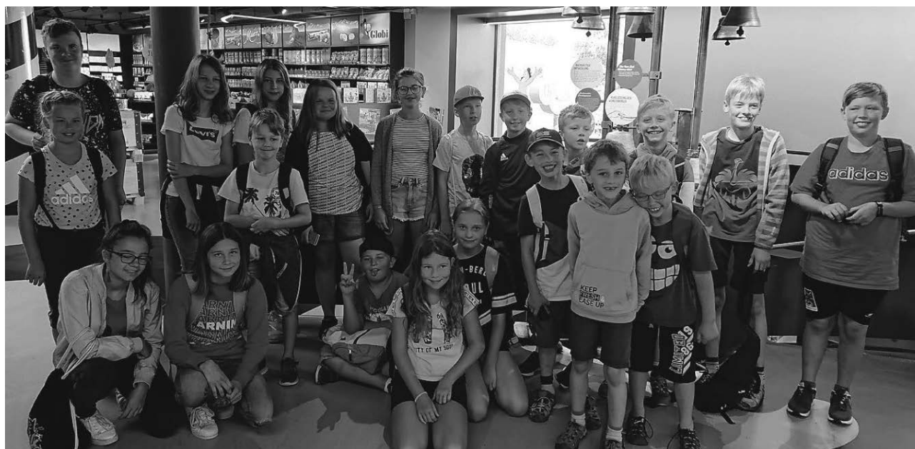
Einer der Höhepunkte des diesjährigen Sommerferienprogramms des Kinder- und Jugendbüros war der Besuch einer schweizerischen Schokoladenfabrik.

Sigmaringen/pa - Der Arbeitskreis Verkehrssicherheit bietet ein Verkehrssicherheitstraining für Senioren an. Ältere Menschen über 65 Jahre stellen im Landkreis inzwischen über 20 Prozent der Bevölkerung dar und haben neben der Risikogruppe der jungen Erwachsenen die höchste Unfallbelastung im Straßenverkehr. Viele dieser älteren Menschen sind auch Führerscheininhaber und nehmen täglich aktiv am Straßenverkehr teil. Hier möchte der Arbeitskreis Verkehrssicherheit des Landkrei-