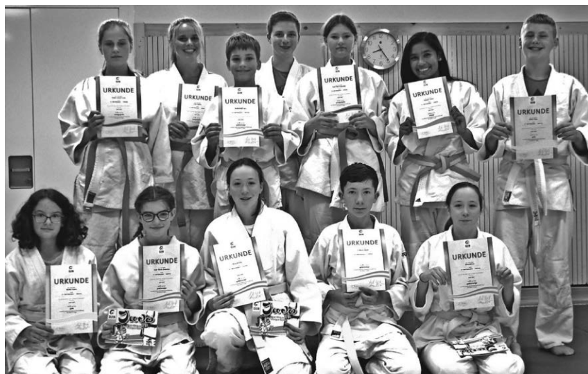
13 Jugendliche der Judoabteilung im Turnverein haben die Kyu-Prüfung abgelegt.