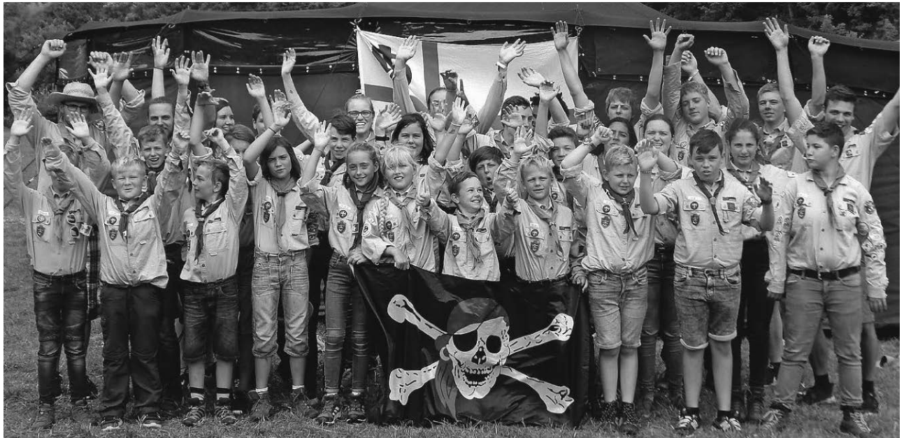
Die St. Georgspfadfinder verbrachten ein abwechslungsreiches Sommerlager im Donautal.

Aach-Linz/pa - Der Förderverein Montessori Bildungshaus veranstaltet am Samstag, 14. September, wieder einen Kinderkleiderbasar für Selbstverkäufer. Er findet von 9.30 bis 11 Uhr in der Schlossgarten-Halle statt. Die Tischgebühr beträgt sechs Euro pro Tisch. Das Kindergarten-Team bietet eine Kinderbetreuung an. Die Eltern servieren Kaffee