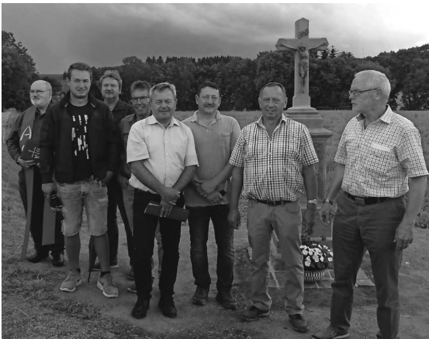
Viele freiwillige Arbeitsstunden leisteten die Helfer, bis das Wegkreuz wie- der in schönem Glanz erstrahlte.

Pfullendorf/pa - Das nächste Treffen der Singetse findet am Mittwoch, 11.