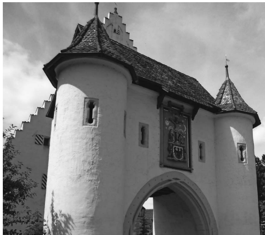
Am Tag des Denkmals findet in diesem Jahr eine Führung im Obertor statt.

Pfullendorf/hsg - Die Tourist-Information teilt mit, dass am Sonntag, 8. September, der diesjährige Tag des offenen Denkmals stattfindet. Bundesweit werden an diesem Tag besonders sehenswerte Gebäude und Einrichtungen, die sonst nicht frei zugänglich sind, für die Besucher geöffnet. In Pfullendorf wird das Obertor geöffnet und eine Führung in dem historischen Gebäude angeboten. Die Führung beginnt um 11 Uhr im Alten Haus. Während der etwa 90-minütigen Führung erfahren die Teilnehmer mehr über die ehemaligen Stadttore sowie die Geschichte und Nutzung des Obertors. Meistert man die zahlreichen Stufen bis hinauf in den Wachturm, erhält man in 38 Metern Höhe einen herrlichen Blick über die Stadt. Besonders interessant sind sicherlich die ehemaligen Gefängniszellen. Ein kurzer Fußmarsch führt außerdem zu noch sichtbaren Resten der einstigen Stadtmauer. Die Kosten für die Führung betragen vier Euro pro Person. Eine Anmeldung ist nicht erforderlich.