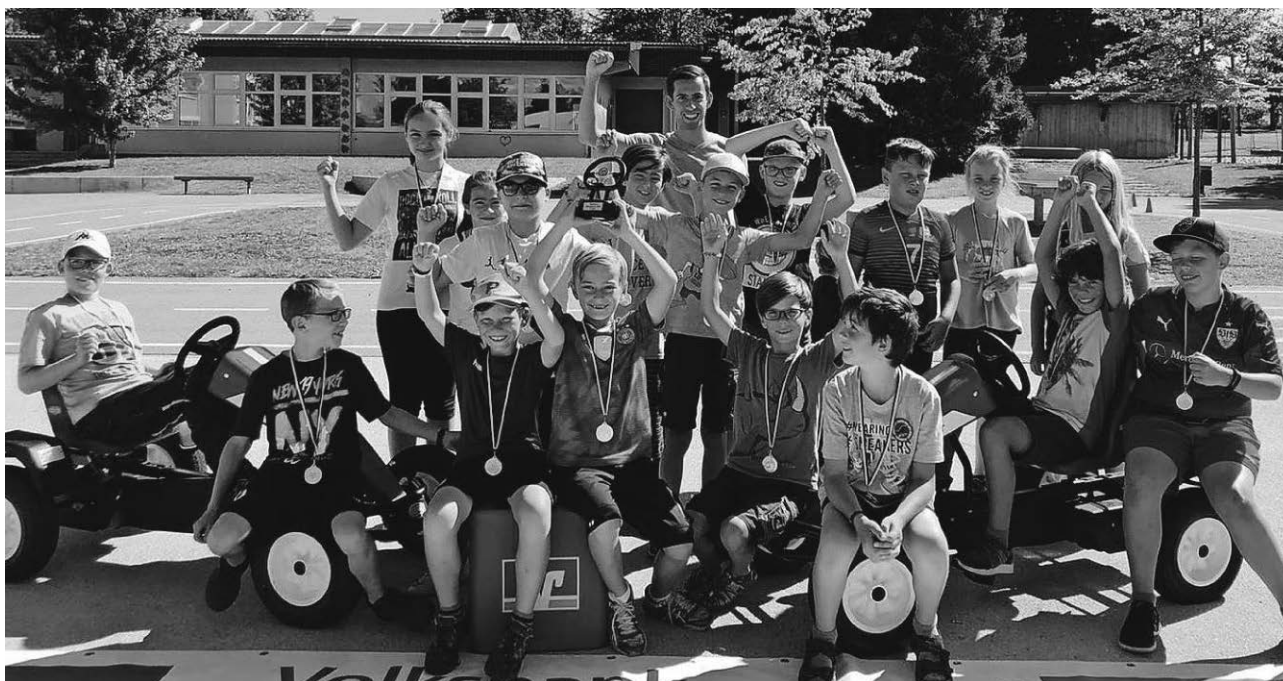
Die Volksbank lud im Rahmen des Sommerferienprogramms zu einem tollen Kettcar-Rennen ein.