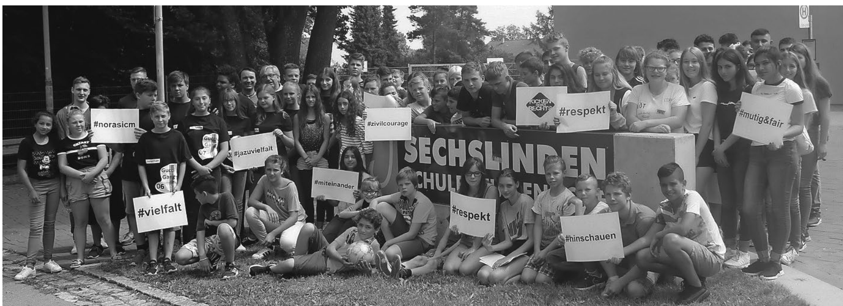
Die Schüler der Sechslinden-Schule werben mit einem Fußballturnier für Toleranz gegenüber Menschen mit fremdländischer Herkunft.