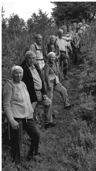
Die Mitglieder des Schwäbischen Albvereins erlebten eine interessante Wanderung bei den Keltengräbern in Hundertsingen.