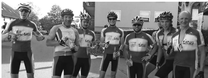
Die Mitglieder des Radlerclubs sammelten wieder bei der Benefiz-Veranstaltung in Hohenbodmann Geld für einen guten Zweck.

mer wagten sich 14 Mannschaften auf den See, darunter erstmals auch ein reines Frauen-Team der Schallweiber im obligatorischen „Sonnenbrillen-Outfit“ und als auswärtige Gäste die eleganten „Katzen“ aus Meßkirch „mit dem Turbo unter den roten Mänteln“. Am Ende entschieden die jungen Stadtmusiker den Wettkampf für sich, gefolgt von den Titelverteidigern „Schwäbischer Alkverein“ und den Radlerkameraden „Bike & Beers“. Unterhaltung gab es genug, vor allem für die kleinen Besucher, für die die Narren wieder die Bahnhofstraße in eine riesige Spielstraße mit Hüpfburg, Karussell, Sandhaufen und Bastelangeboten verwandelt hatten. Und wer Lust hatte, konnte mit den Pfadfindern eine Bootsfahrt auf dem See unternehmen. Zur Stimmungsmusik des Bläserquintetts „Quattro Poly“ aus dem Allgäu ließen die Besucher den lauen Sommerabend in fröhlicher Gemeinschaft am Biertisch, an der Theke des Weizenbierstands oder an der Cocktailbar ausklingen. Auch beim Feierabendhock am Montag trübte kein Wölkchen die