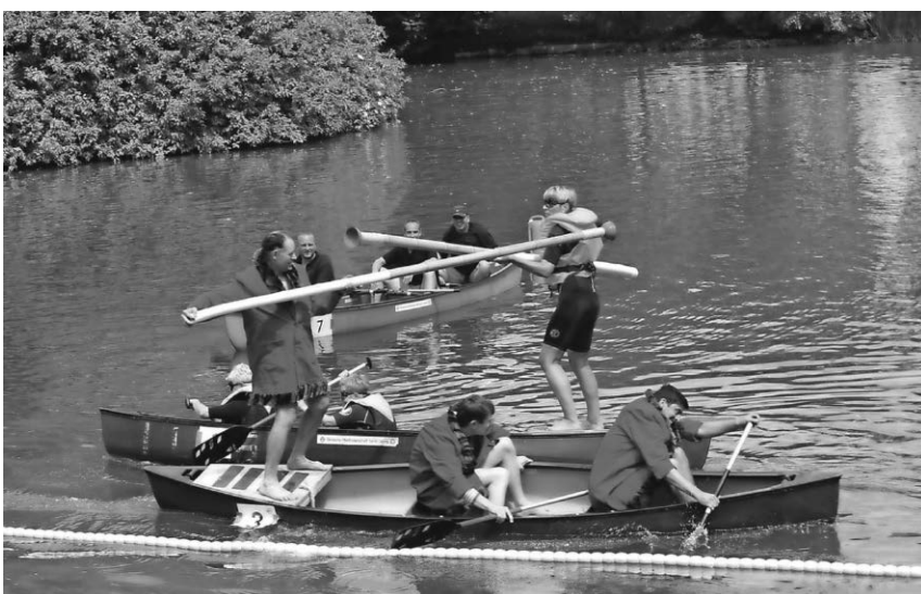
Höhepunkt war wieder das Fischerstechen auf dem Stadtsee, bei dem mancher Teilnehmer ein unfreiwilliges Bad nehmen musste.