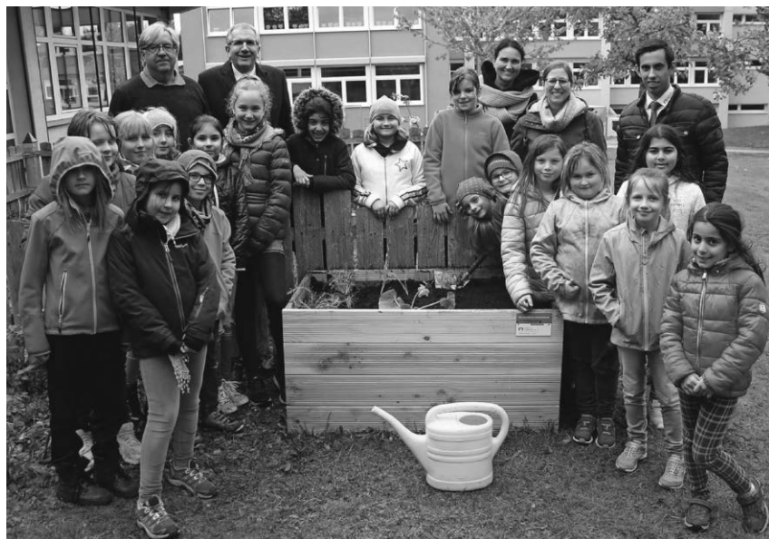
Die Grundschüler der Sechslinden-Schule hatten beim Bepflanzen des Hochbeets viel Spaß.

Pfullendorf/pa - Zur Sensibilisierung und Förderung der Nachhaltigkeit unterstützt die Volksbank Pfullendorf im Rahmen des Projekts Garten3 die Grundschule Denkingen und die Grundschule Sechslinden. Beiden Schulen erhielten ein Hochbeet mit verschiedenen Sämereien. Die Schüler erhalten so die Gelegenheit, Pflanzen in ihrer Entwicklung von der Keimung bis zur Ernte zu beobachten. Dadurch gewinnen sie praktische Kenntnisse über Pflanzen. Beim Einpflanzen der Samen und verschiedener Kräuter hatten die Kinder eine Menge Spaß.