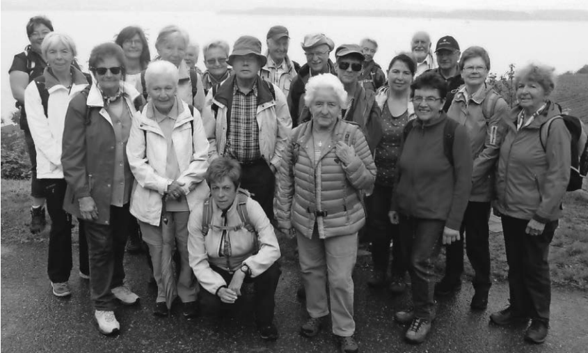
Die Wanderfreunde des Schwäbischen Albvereins und des DAV waren gemeinsam am Bodensee unterwegs.