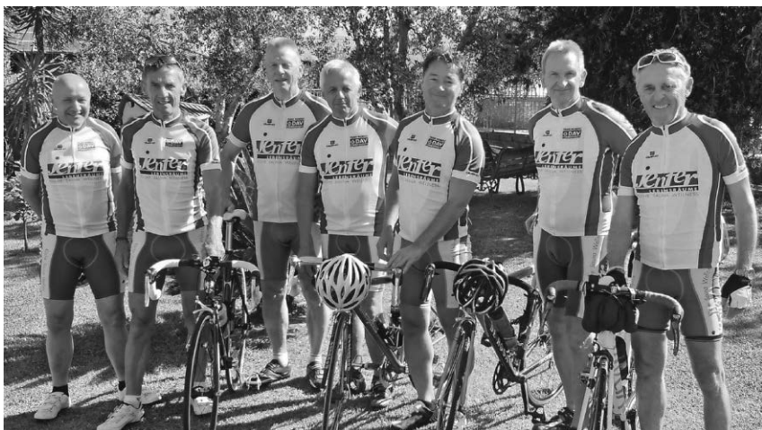
Das Team Nordic des DAV war mit den Rennrädern in der Toscana unterwegs.