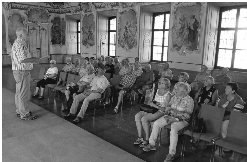
Die Geberit-Rentner besuchten bei ihrem Jahresausflug auch die imposante Klosterkirche in Obermarchtal.

Mottschieß/pa - Auch in diesem Jahr hat die Narrengesellschaft Mottschieß wieder zum beliebten Sommerfest eingeladen. Viele Besucher fanden den Weg in die Sauter-Halle. Zur Unterhaltung spielten die „Flotten Grenzler“ aus Burgweiler. Die Gäste schätzten wieder den Mittagstisch mit dem selbst gemachten Kartoffelsalat und die große Kuchenauswahl. Den Höhepunkt bei den unterhaltsamen Spielen stellte