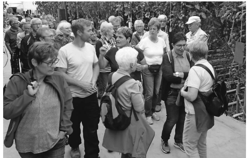
Die Mitglieder des Schwäbischen Albvereins besuchten die Gemüseplantage in Schwackenreute.

Pfullendorf/pa - Das Netzwerk 50plus lädt alle älteren Menschen, ob als Einzelperson, zu zweit oder in einer kleinen Gruppe, zum Gemeinsamen Mittagstisch für Senioren ein. Er findet nun in den Frühjahrs- und Sommermonaten wieder regelmäßig freitags im Seepark-Restaurant „Lukullum“ beim Osteingang des Seeparks statt. Von 11.45 bis 14 Uhr reserviert das Restaurant eigens einen Tisch für die fröhliche Runde aus Frauen und Männern, die ihr Mittagessen gern in Gesellschaft einnehmen möchten. Neben dem Essen her wird freundschaftlich geplaudert, gelacht oder auch ernsthaft diskutiert. Neue Teilnehmer werden gern und herzlich in die Runde aufgenommen. Eine regelmäßige Teilnahme ist nicht erforderlich. Das „Lukullum“ bietet