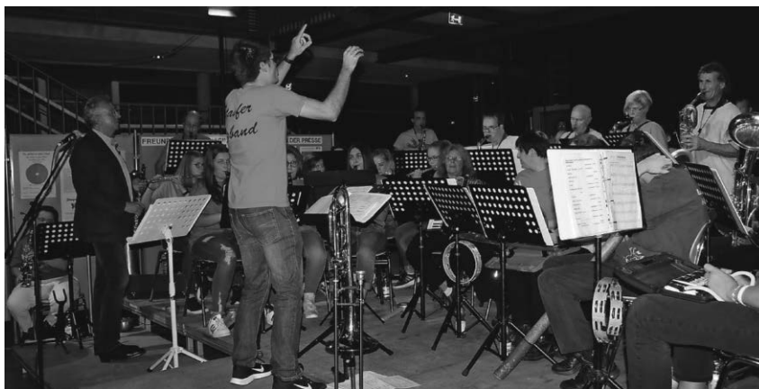
Der Rotary Club lädt wieder zum Gemeinschaftskonzert der Bigband des Staufer-Gymnasiums und der Lautenbacher Blaskapelle ein. Es findet in diesem Jahr in Lautenbach statt.

Schriftliche Anmeldungen bitte an VHS-Pfullendorf, Kirchplatz 1, 88630 Pfullendorf, Fax 07552/931 131 oder E-Mail: Hermine.Reiter@stadt-pfullendorf.de . Telefonische Auskünfte erteilt die Volkshochschule unter Telefon 07552/25-1130 (Montags, dienstags und donnerstags jeweils am Vormittag).