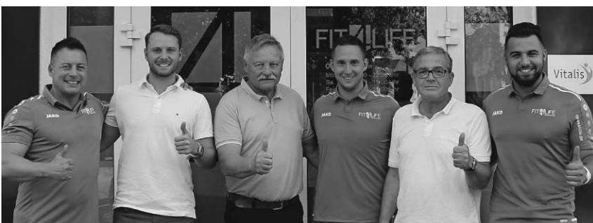
Das Fitnessstudio Fit4life hat den Kooperationsvertrag mit dem SC Pfullendorf verlängert.

Unsere Empfehlung: Fragen Sie beim jeweiligen Anlass vor dem Fotografieren und bitten Sie Personen, die mit der Veröffentlichung nicht einverstanden sind, für die Dauer des Fotografierens „aus dem Bild“ zu gehen. Wir bedauern diese Einschränkung, bitten aber dringend um Beachtung. Ihr Team von Pfullendorf aktuell