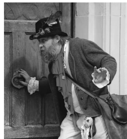
Die Tourist-Information bietet wieder eine Rüberführung durch die Altstadt mit dem Ganoven Grandscharle an.

nehmerzahl ist begrenzt. Eine Anmeldung bei der Tourist-Information unter Telefon 07552/251131 ist unbedingt erforderlich. Weitere Rüberführungen sind für den 14. August und den 4. September geplant.