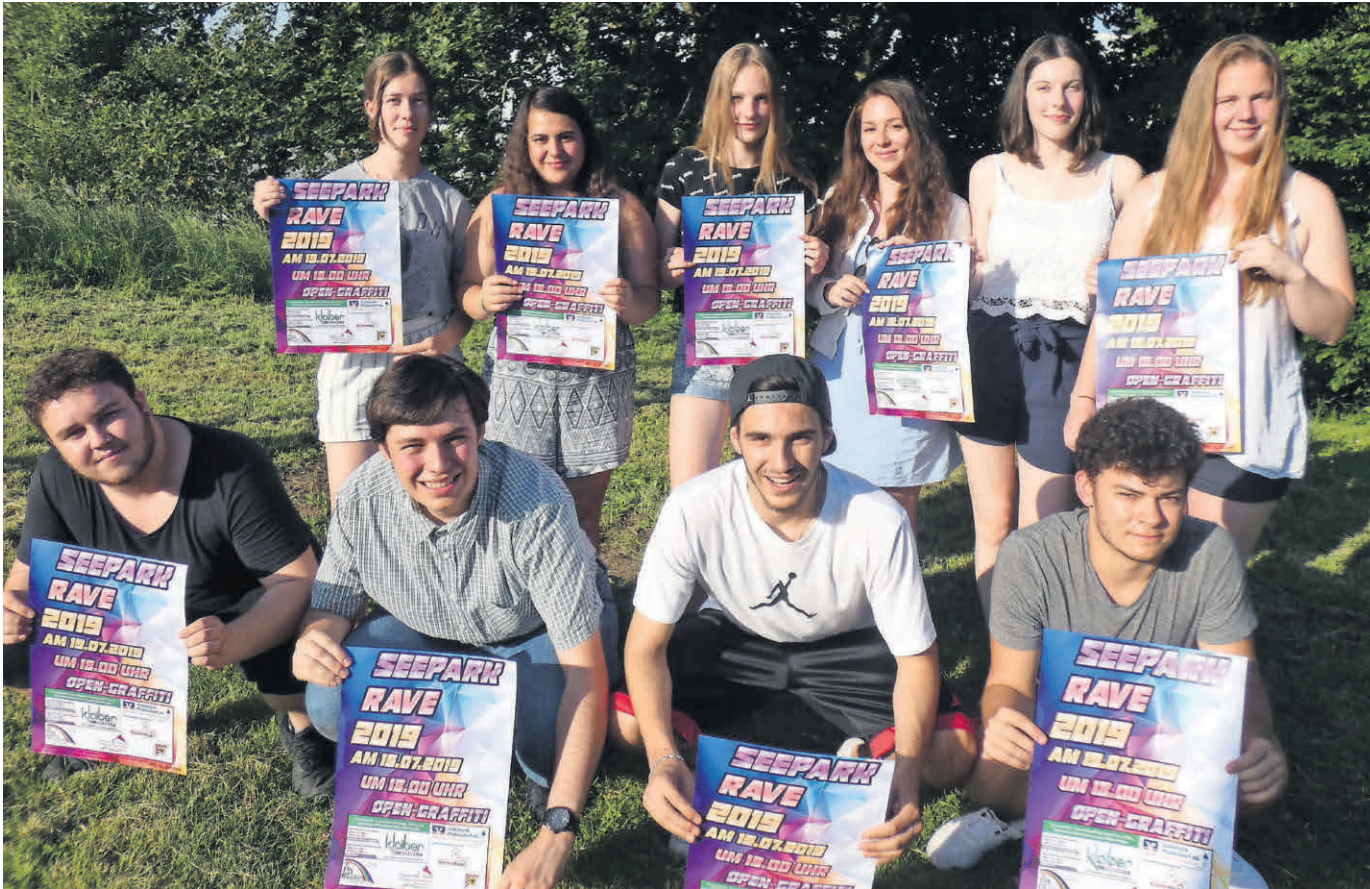
Der Verein für Jugend und Kultur und das Kinder- und Jugendbüro veranstalten am 19. Juli eine Jugendparty im Seepark. Von 18 bis 24 Uhr können Jugendliche und junge Erwachsene ab 14 Jahren ausgelassen feiern. Einer der Höhepunkte ist ein Open Graffiti.

Amtliches Mitteilungsblatt der Stadt Pfullendorf und ihrer Stadtteile Aach-Linz, Denkingen, Gaisweiler, Großstadelhofen, Mottschieß, Otterswang, Zell a. A.