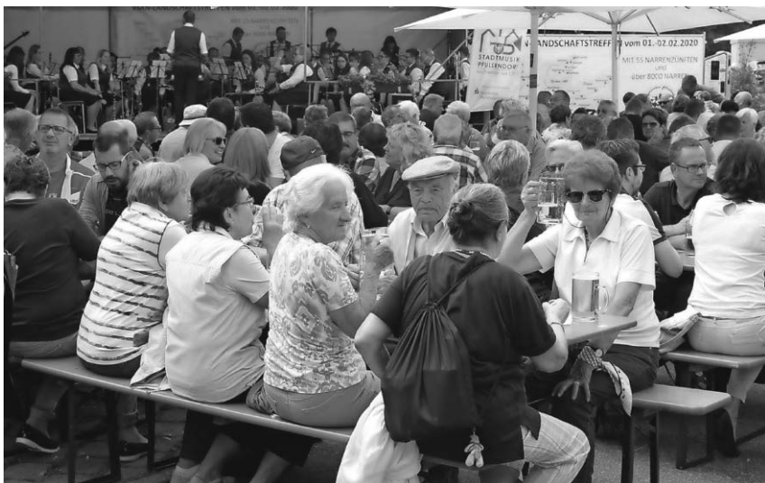
Dank des tollen Wetters war das Stadtseefest an allen drei Tagen sehr gut besucht.