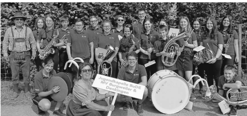
Die Jugendkapelle Denkingen/Burgweiler erlebte einen abwechslungsreichen Tag beim Internationalen Jugendkapellentreffen in Altach.

Der Sonntag startete bewölkt, aber trocken und so stand auch da dem Festvergnügen nichts im Weg. Schon am Vormittag zum Frühschoppen mit der Stadtmusik fanden sich viele Gäste auf dem Festgelände ein und