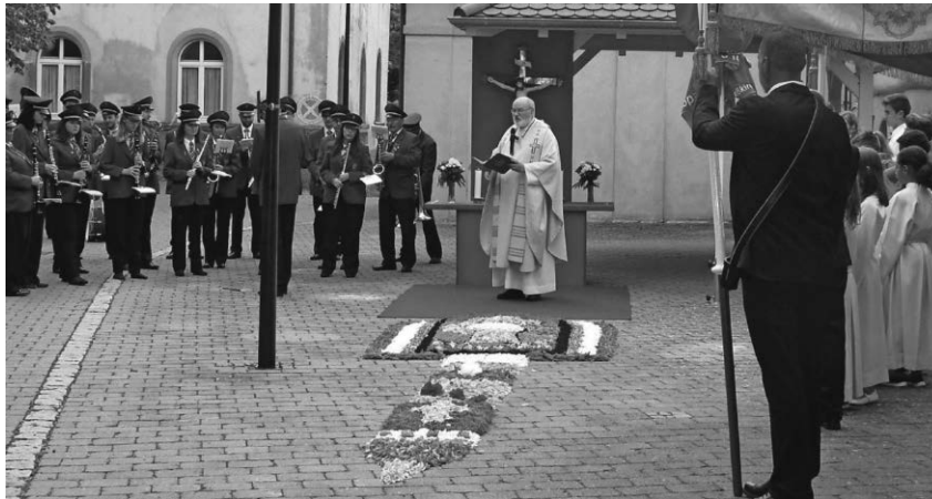
An Fronleichnam zierten wieder schöne Blumenteppiche der Frauengemeinschaft den Prozessionsweg.