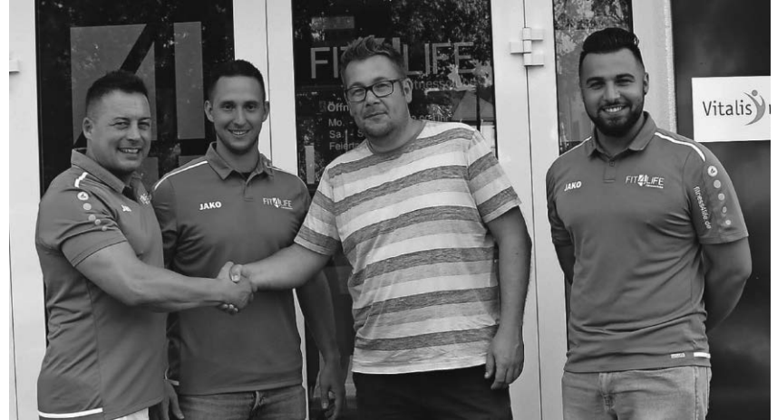
Die Handballer des Turnverein können weiterhin auf die Unterstützung des Fitness-Clubs Fit4life setzen.

Pfullendorf/pa - Die Handballabteilung des Turnverein Pfullendorf hat ihre Kooperation mit dem Fitness-Club Fit4life um ein weiteres Jahr verlängert. Nach dem Abstieg in die Bezirksklasse hält der Club dem Verein trotzdem die Treue. „Eine solche Situation ist für viele im Verein nicht einfach. Wir wollen jedoch unserem Partner den Rücken