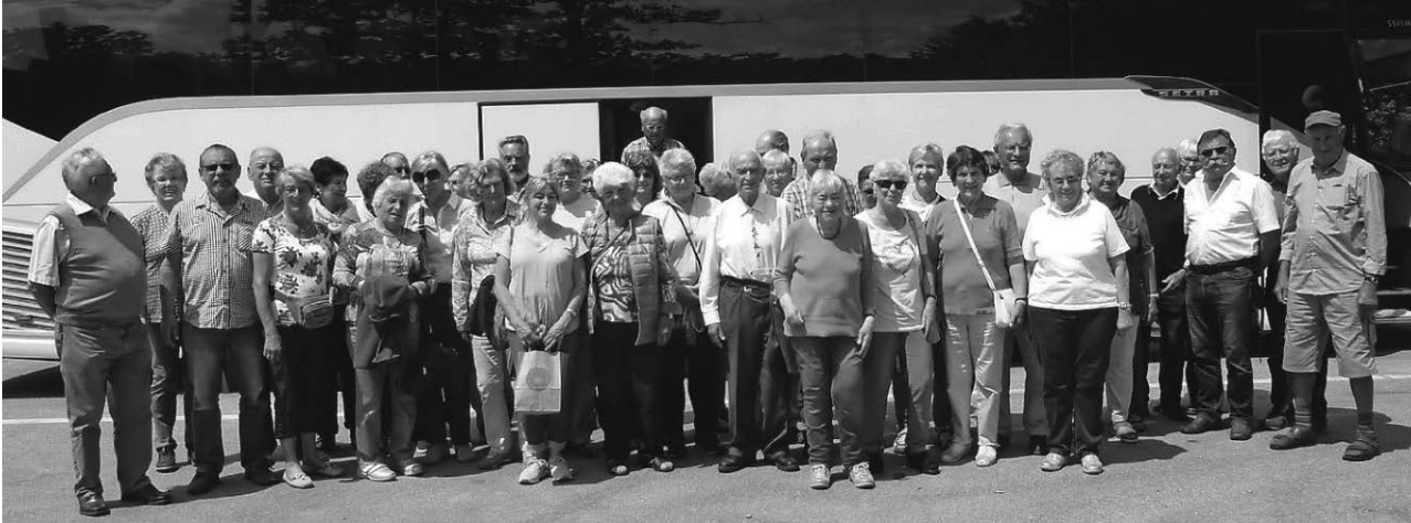
Die Senioren des DAV erlebten abwechslungsreiche Tage im Gebirge.