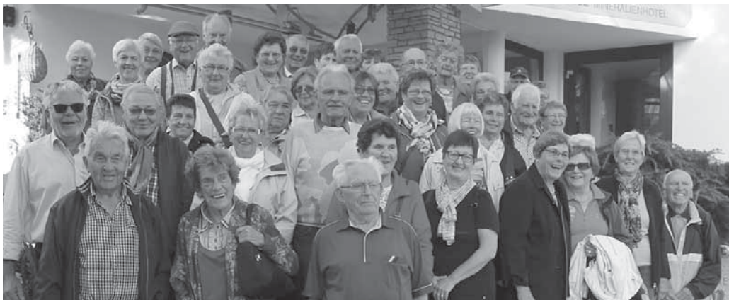
Die Senioren der Seelsorgeeinheit erlebten abwechslungsreiche Tage in Südtirol.

Tourist-Information Montags – freitags, 9 – 12 Uhr