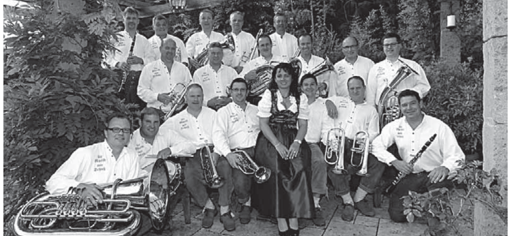
Die Blaskapelle Peng sorgt beim Herbstfest in Aach-Linz für Stimmung.

Pfullendorf/pa – Die Tourist-Information am Marktplatz bittet alle Kulturschaffenden und Vereinsvorstände, regelmäßig ihre Termine und Veranstaltungen für den Veranstaltungskalender einzureichen. Termine können so leichter abgestimmt und Terminüberschneidungen vermieden werden. Alle Termine sind online unter www.noerdlicher-boden-see.de und www.pfullendorf.de abrufbar sowie in einer zweimonatigen Vorschau im Bürgerbüro erhältlich. Wer seine Veranstaltungstermine noch nicht übermittelt hat oder vielleicht eine Veranstaltung abgesagt beziehungsweise auf ein anderes Datum verlegt hat, wird gebeten, dies der Tourist-Information zu melden. Es werden jederzeit Termine und Ergänzungen per E-Mail an tourist-information@stadt-pfullendorf.de oder per Fax an 07552/931130 entgegen genommen.