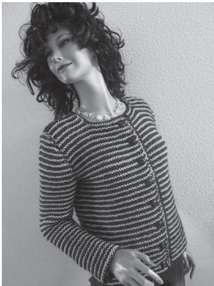
Im neuen Wolle Outlet gibt es Wolle für unterschiedlichste Strickideen.