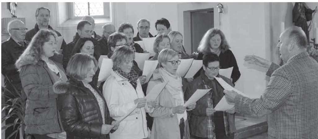
Der Kirchenchor Otterswang bereitet sich auf das traditionelle Benefizkonzert vor, das am 28. Oktober in Maria Schray stattfindet.

Aach-Linz/pa – Die Musikkapelle Aach-Linz veranstaltet am Samstag, 21. Oktober, ein Herbstfest der Blasmusik in der Schlossgarten-Halle. Die Blaskapelle „Rigi-Spatzen“ aus der Schweiz und die Blaskapelle