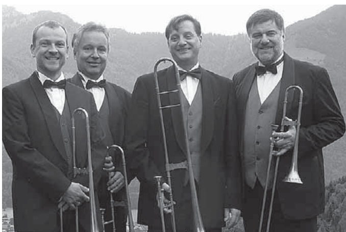
Das Posaunenquartett »Opus« gibt ein Konzert in der Christuskirche.

Oktober, von 8.30 bis 9.30 Uhr am Stadtgartenvorplatz. Folgende Problemstoffe können beim Schadstoffmobil abgegeben werden: Reste von Reinigungsmitteln, Unkrautbekämpfungsmitteln und Pflanzenschutzmitteln, Holzschutzmittel, Spraydosen mit Restinhalten, Imprägniermittel, Photochemikalien, Wachs, Schmierfette, Kleber, Säuren, Laugen, Salze, Quecksilber, Lösungsmittelhaltige Farben und Lacke in flüssigem Zustand, Beizmittel, Lösungsmittel, Leuchtstoffröhren, Energiesparlampen, Batterien aller Art und maximal drei Starterbatterien pro Haushalt und andere schadstoffhaltige Stoffe, die nicht in den Restmülleimer oder ins Abwasser gehören. Nicht angenommen werden beim Schadstoffmobil: Lösungsmittelfreie Farbreste wie Dispersionsfarben oder Abtönfarben aber auch sonstige ausgetrocknete Farb- und Lackreste. Diese sind im ausgetrockneten Zustand über den Restmüll zu entsorgen. Weiterhin nicht angenommen werden Altöle, Kühlgeräte, Fernsehgeräte, PC-Monitore sowie Problemstoffe beziehungsweise Sondermüll aus dem Gewerbe. Für Altöle besteht eine Rücknahmepflicht der Verreiber. Kühlgeräte, Fernseher sowie PC-Monitore werden auf der Entsorgungsanlage Ringgenbach, Umladestation Bad Saulgau und ehemaligen Umladestation Gammertingen kostenlos angenommen. Starterbatterien werden zwar bei der Schadstoffsammlung angenommen, können aber