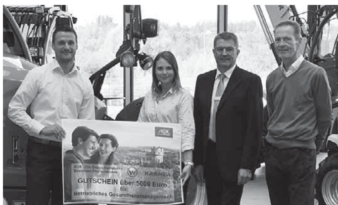
Die Kramer Werke erhielten eine Förderung in Höhe von 5000 Euro zur Unterstützung des Programms für Gesundheitsförderung.