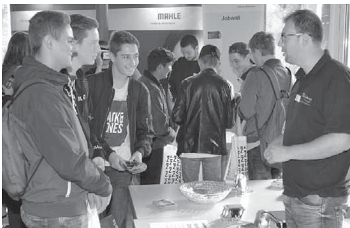
Schüler aus allen weiterführenden Schulen in Pfullendorf und aus den Schulen in der Umgebung informierten sich bei der Ausbildungsbörse über ihre beruflichen Möglichkeiten.

Jahr wurden über 20 000 Euro ausgezahlt.