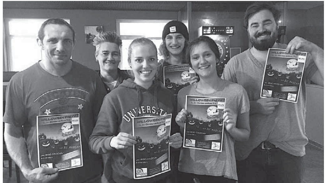
Die Organisatoren der Halloween-Partys freuen sich auf viele Besucher ab der fünften Klasse bei der Party im M-Life und auf viele Grundschüler bei der Party im Jugendhaus.