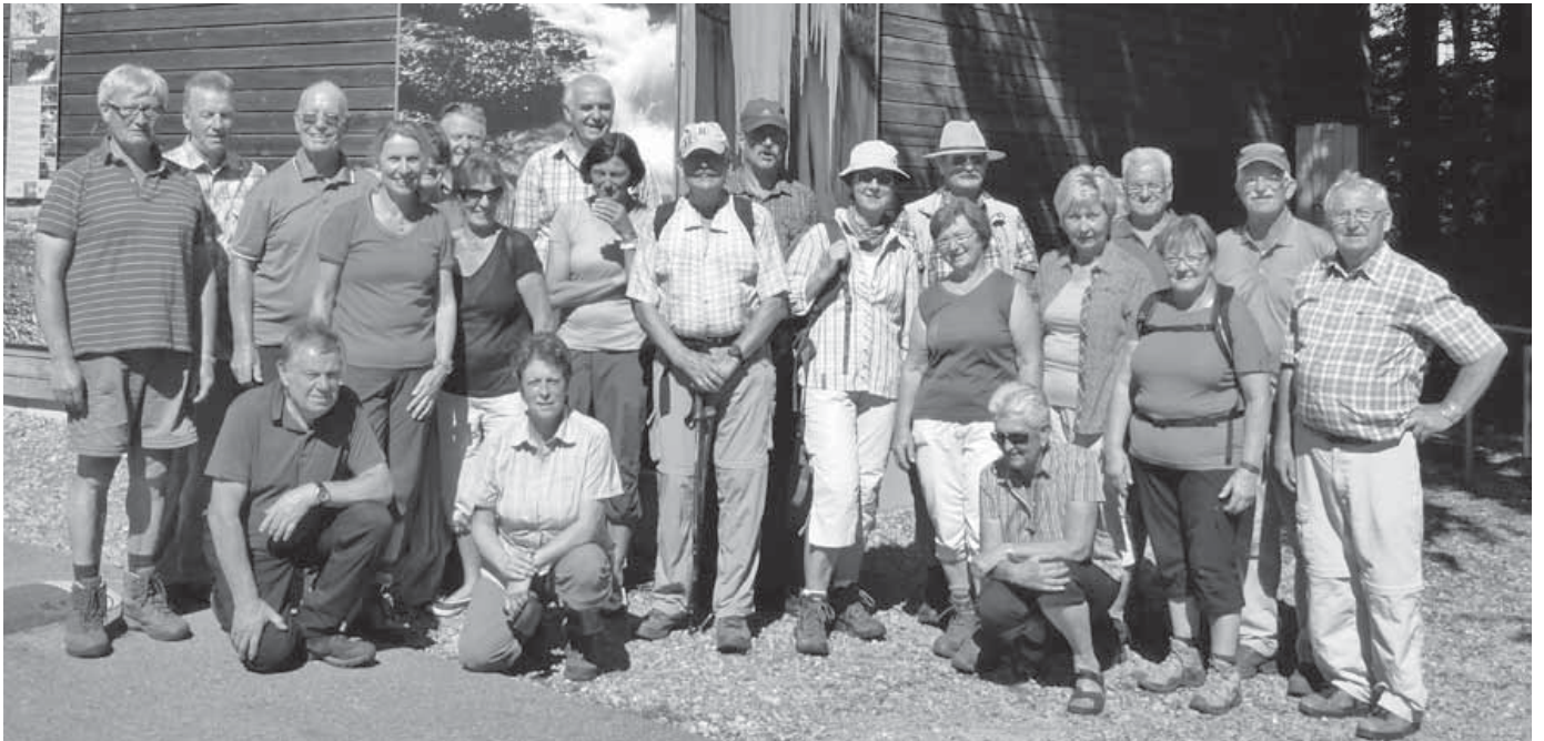
Die Senioren des DAV unternahmen eine Wanderung im Allgäu.