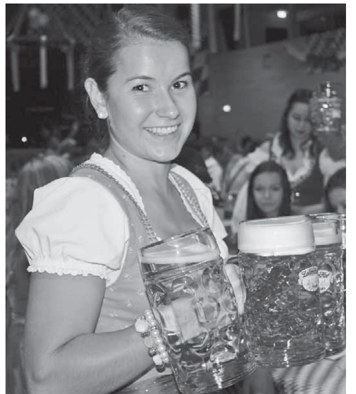
Im Kehlbachstüble wird am ersten Oktoberwochenende drei Tage lang Oktoberfest gefeiert.