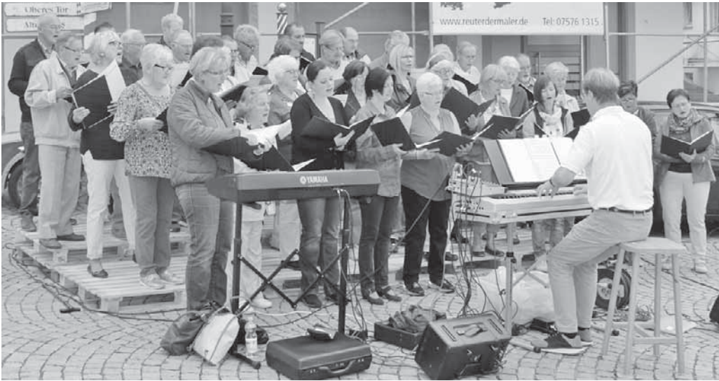
Die Gesangverein unter der Leitung von Rainer Kempf unterhielt das Publikum mit fetziger Schlagermusik.