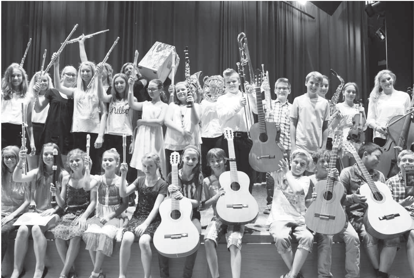
Alle Kinder und Jugendlichen und natürlich auch alle Erwachsenen, die ein Musikinstrument erlernen wollen, sind am Samstag zum Schnuppertag des Stadtmusikforums eingeladen.