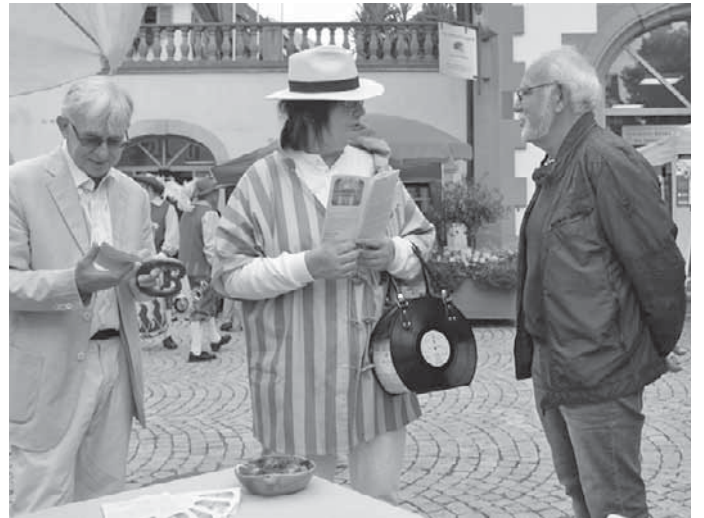
An den Informationsständen, hier der Stand von Netzwerk 50plus, gab es viele nette Begegnungen mit neuzugezogenen und alteingesessenen Pfullendorfern.