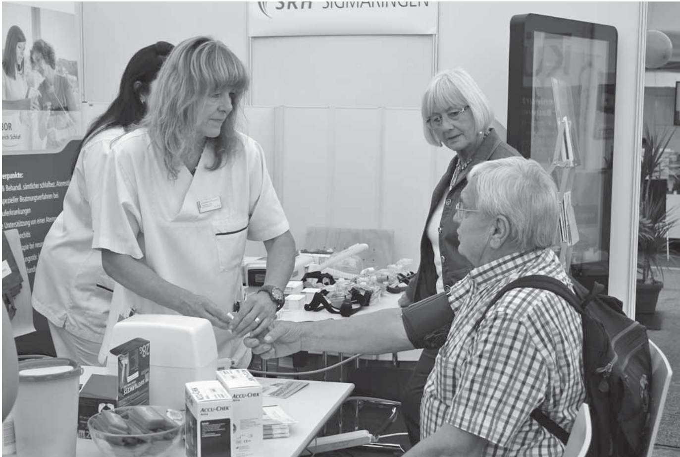
Am Wochenende findet wieder die Seepark-Schau im Seepark statt. Neben vielen Ausstellern aus Handwerk und Dienstleistung gibt es auch interessante Vorträge und Veranstaltungen. Mit dabei ist auch wieder die SRH Klinik Pfullendorf.

Informationen zu Gesundheit und Behandlungsmethoden. Wer nicht nur zuhören, sondern auch gleich einen kurzen Gesundheitscheck machen möchte, kann den Stand des SRH Klinikums Pfullendorf besuchen. Dort werden unterschiedliche Messungen und Tests durchgeführt. Ein weiteres Highlight ist das Gutscheineheft und der Messe-Parcours. Das Gutscheineheft zur Messe beinhaltet Gutscheine von verschiedenen Ausstellern, die exklusiv für die Seepark-Schau gültig sind. Der Messe-Parcours bietet allen Besuchern die Möglichkeit, durch das Besuchen bestimmter Aussteller tolle Preise, wie zum Beispiel ein Wellness-Wochenende für zwei Personen und vieles mehr, zu gewinnen. Auch die Stadtwerke Pfullendorf bringen sich mit der Energie-Piazza in die Seepark-Schau ein und bieten brandneue Themen zur Energienutzung. Ganz neu ist auch die Vereinspromenade. Hierbei stellen sich Vereine aus Pfullendorf und der Umgebung vor und bieten die Möglichkeit sich zu informieren und Mitglied zu