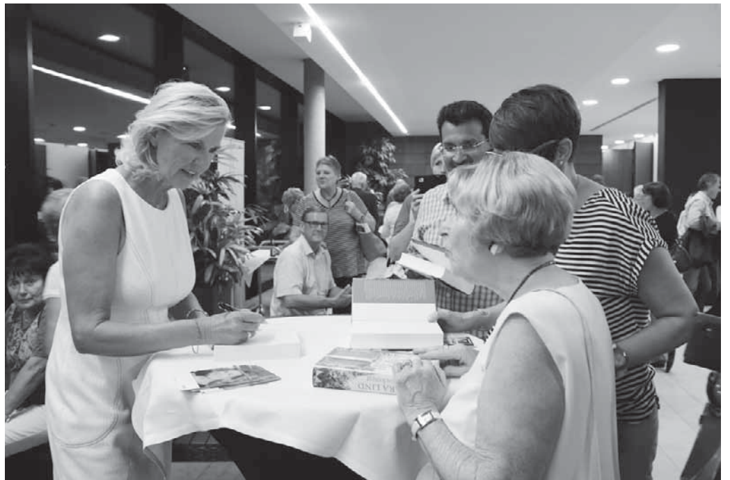
Das Netzwerk 50plus unternahm erstmals eine Kulturfahrt zu einer Lesung. In der Pause suchte die Autorin Hera Lind das Gespräch mit den Besuchern und signierte Bücher.

Pfullendorf/pa – Das nächste Treffen des Skatclubs im