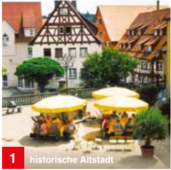
1 historische Altstadt