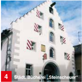
4 Städt. Bücherei „Steinscheuer“