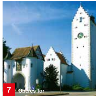
7 Oberes Tor