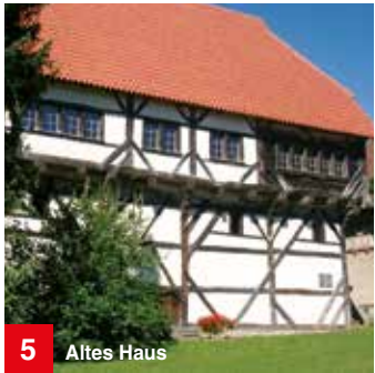
5 Altes Haus