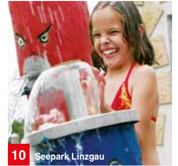
10 Seepark Linzgau