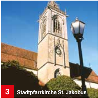
3 Stadtpfarrkirche St. Jakobus