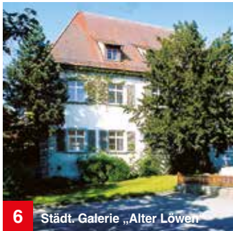
6 Städt. Galerie „Alter Löwen“