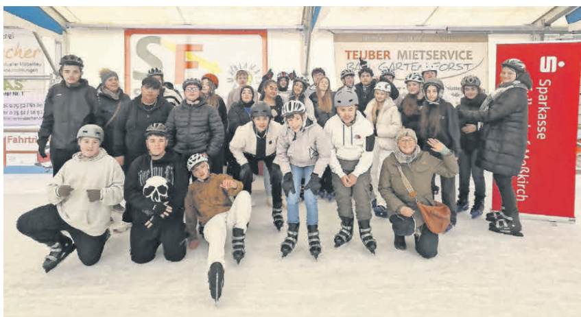
Die Neun- und Zehntklässler der Sechslinden-Schule freuen sich über die Einladung der Sparkasse zum kostenfreien Eislaufen.

auch die Walzer und Polkas des großen Johann Strauß dürfen beim Neujahrskonzert nicht fehlen. Der Einlass beginnt um 19.45 Uhr. Karten sind ab 22 Euro bei der Tourist-Information erhältlich (Tel.: 07552-251131).