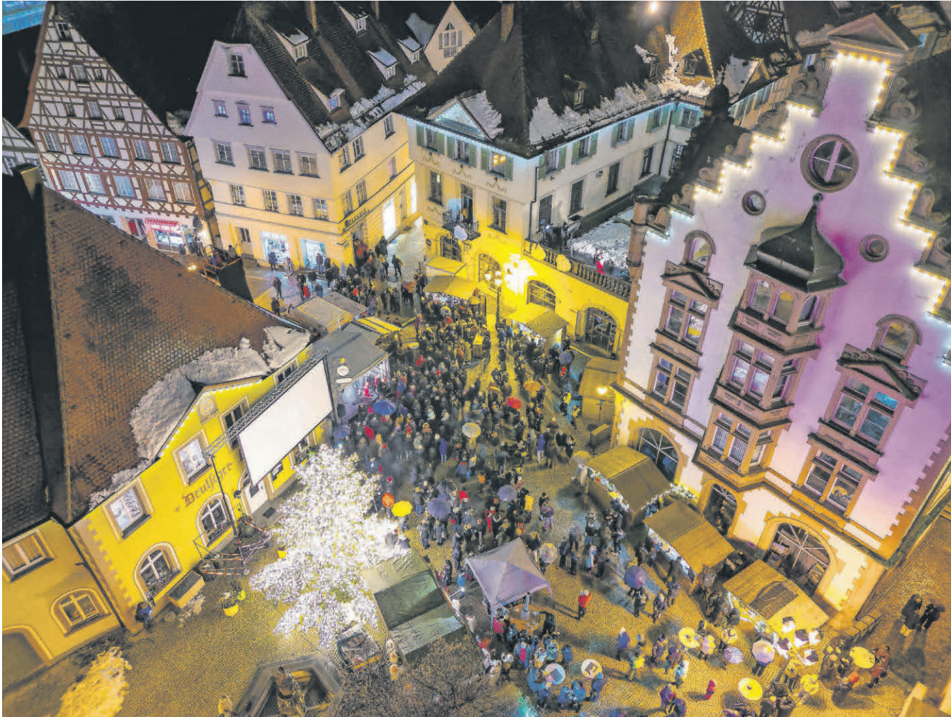
Beim diesjährigen Adventszauber erstrahlt die Pfullendorf Altstadt in einem wunderschönen Lichtermeer.

Amtliches Mitteilungsblatt der Stadt Pfullendorf und ihrer Stadtteile Aach-Linz, Denkingen, Gaisweiler, Großstadelhofen, Mottschieß, Otterswang, Zell a. A.