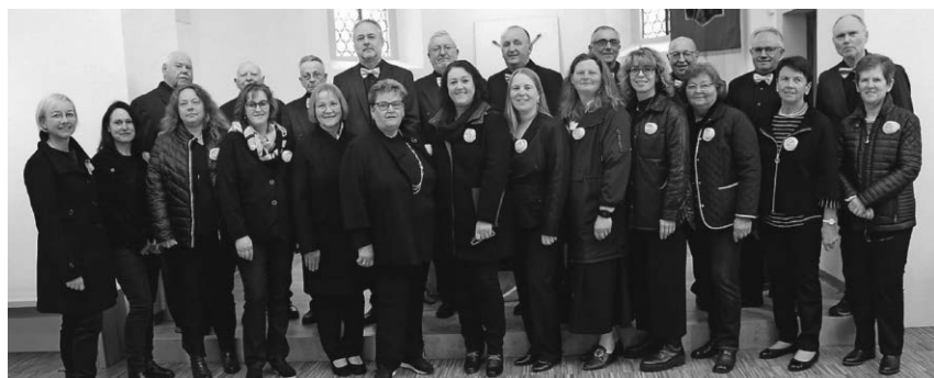
Der Otterswanger Kirchenchor lädt zu einem Benefizkonzert am Sonntag, den 17. Dezember ein.

Pfullendorf/pa - Das Alten- und Pflegeheim der Spitalpflege veranstaltet wieder in Kooperation mit der Apotheke am Obertor die Aktion Wunschbaum. Rechtzeitig zum ersten Advents wurde in der Apotheke