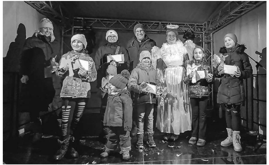
Beim Adventszauber wurden die per Zufall ausgewählten Gewinner-Engel prämiert.

Pfullendorf/rc – Im Anschluss an die bestehenden Wohngebiete Obere Bussen I und II soll nun ein zusätzliches Baugebiet „Obere Bussen III“ ausgewiesen werden. Für das hierfür notwendige Bebauungsplanver-