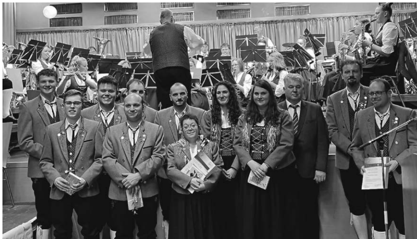
Das Jubiläumskonzert nahm der MV Otterswang zum Anlass, langjährige Vereinsmitglieder zu ehren.