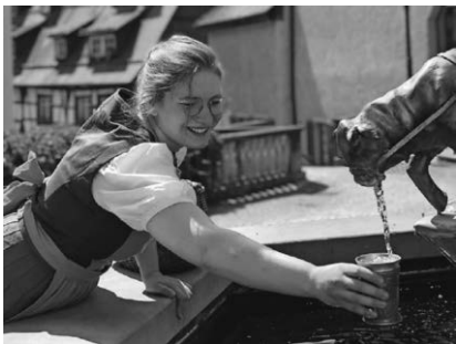
Die Schankmagd Josepha gibt bei einer Schauspielführung am 24. September wieder einige Geheimnisse und Informationen zum Besten.

Pfullendorf/hsg - Am Sonntag, 24. September, bietet die Tourist-Information Pfullendorf um 10:45 Uhr die Schauspielführung „Von Bürgern, Bier und alten Zeiten – die Schankmagd Josepha erzählt...“ an. Josepha schwätzt wie ihr der Schnabel gewachsen ist und plaudert so manche Geheimnisse der Stadt sowie Eigenheiten deren Bewohner aus. Der Stadtrundgang zeigt wie das wirkliche Leben im Pfullendorf des Jahres 1774 war. Treffpunkt ist an der Sitzgruppe vor der Tourist-Information am Marktplatz. Erwachsene bezahlen 5,- Euro, Kinder bis 12 Jahre sind frei. Eine Anmeldung bei der Tourist-Information unter Tel. 07552-251131 oder per E-Mail an tourist-information@stadt-pfullendorf.de ist aufgrund der beschränkten Teilnehmerzahl unbedingt erforderlich.