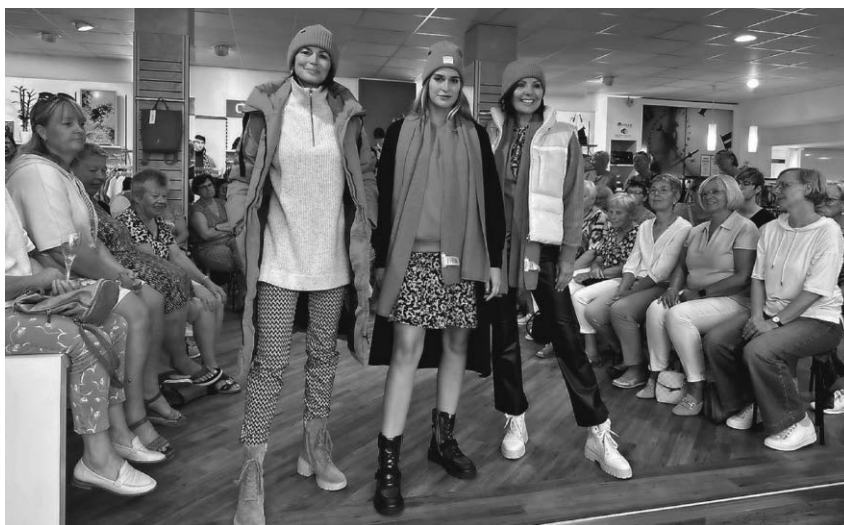
Profimodels präsentierten den Besuchern der Modenschau die Trends der bevorstehenden Saison.

Pfullendorf/pa - Passend zum bevorstehenden Herbstbeginn hat Langer Mode zur traditionellen Hausmodenschau eingeladen! Wie immer wurde die Modenschau mit Profi-