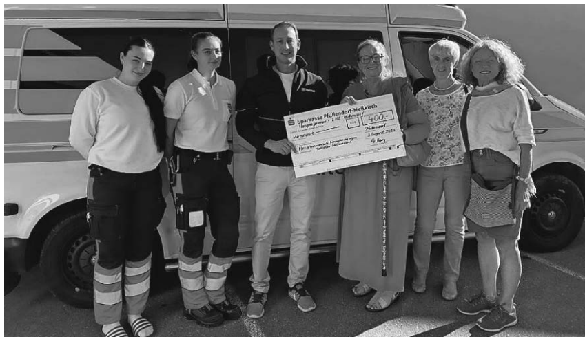
Die Vertreter der Hospizgruppe und der EKE übergeben einen Scheck an die Malteser.

Pfullendorf/pa - Nach der Sommerpause starten beim Netzwerk 50plus am Dienstag, 19. September, wieder die Sprachkreise für Italienisch und Französisch mit Heide Siegel. Die Sprachkreise finden im Treffpunkt am Stadtsee (Am Stadtweiher 18) statt. Der Sprachkreis Italienisch