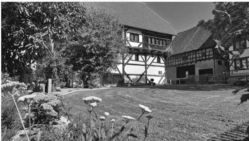
Der Garten des Alten Hauses lädt zum Verweilen und Entspannen ein.

Beuroner Jakobspilgergemeinschaft das Pilgerwegenetz in der gesamten Region. Mit dem aufmunternden Pilgergruß „Ultreia“ („Vorwärts, weiter!“) möchte der bekannte Benediktiner am 20. September um 19 Uhr im Alten Haus seinen Vortrag zu Selbstverständnis und Geheimnis des Pilgerns einleiten, zu dem, was dieses „Beten mit den Füßen“ seit dem Mittelalter und noch heute den Menschen bedeutet, die sich darauf einlassen, sich auf den Weg machen. Interessierte sind herzlich eingeladen, der Eintritt ist frei. Bitte beachten Sie, dass der Vortrag im ersten Obergeschoß des Alten Hauses stattfindet und nicht barrierefrei zugänglich ist.