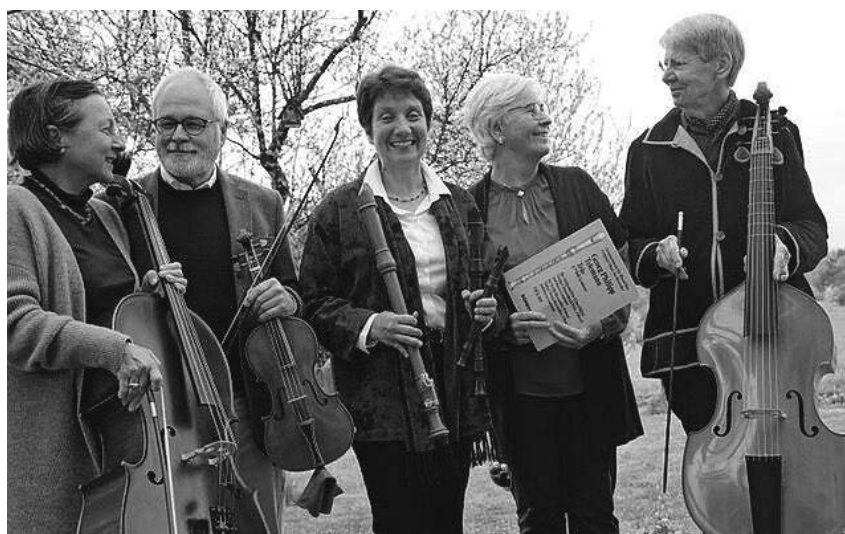
Das Ensemble „ZellBarock“ ist am 18. Juni mit einem Barockkonzert in der Wallfahrtskirche Maria Schray zu Gast.

Pfullendorf/pa - Das Ensemble „Zell- Barock“ ist am Sonntag, 18. Juni, in der Wallfahrtskirche Maria Schray zu Gast. Beginn des Konzerts ist um 18 Uhr. Es erklingen Canzonen und Sonaten aus dem 16. und 17. Jahr- hundert. Neben bekannten Kompo- nisten wie Georg Philipp Telemann oder Antonio Vivaldi stehen auch Werke von weniger bekannten Komponisten wie Tarquinio Merula und Cesare Negri in unterschied- lichsten Besetzungen auf dem ab- wechslungsreichen Programm. Gespielt wird auf typischen Instru- menten der Barockzeit wie Block- flöten, Violine, Viola, Violoncello,