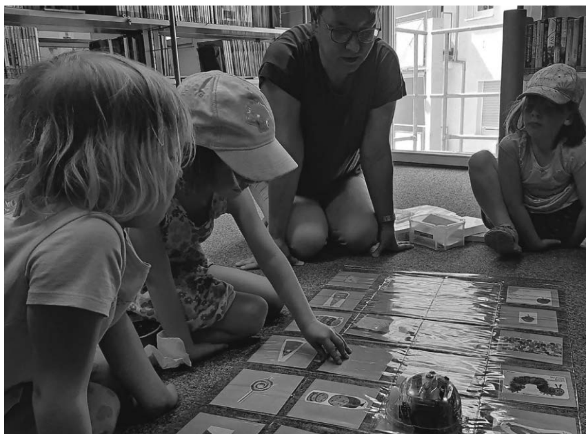
Die Stadtbücherei lädt am Freitag zu einem Kindernachmittag mit dem Bodenroboter Bluebot ein.

Pfullendorf/hsg - Die Stadtbücherei lädt am Freitag, 16. Juni, erstmals zu einer Geschichte mit dem kleinen blinkenden Bodenroboter „Bluebot“ ein. Beginn ist um 15 Uhr. Die Kinder können mit dem Bluebot erste Erfahrungen im Programmieren sammeln. Es gilt, den kleinen Käfer über die Pfeiltasten so zu programmieren, dass er den richtigen Weg findet und die Figuren aus dem Bilderbuch ansteuert. Dabei ist Konzentration, räumliches Denken und Freude am Ausprobieren gefragt. Anmeldungen nimmt die Stadtbücherei telefonisch unter 07552/251200 entgegen.