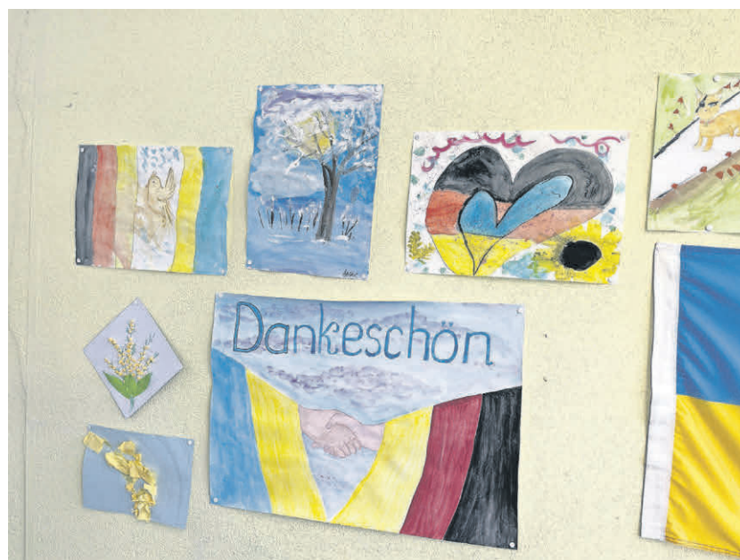
Bilder, die die Kinder und Jugendlichen gemalt haben, und kleine Dankeschreiben machen deutlich, dass sich die Flüchtlinge aus der Ukraine im Begegnungszentrum gut betreut fühlen.

Die Integration der Flüchtlinge verlaufe bisher gut, berichten die ehrenamtlichen Helfer. Die Unterstützungsangebote würden rege genutzt und einige Flüchtlinge hätten bereits Arbeit gefunden oder seien aktiv auf der Suche. Hilfreiche dabei sind nicht nur die verschiedenen Sprachkurse, die von der Volkshochschule oder im Begegnungszentrum angeboten werden, sondern auch die gute Ausbildung, die viele Flüchtlinge aus ihrer Heimat mitgebracht haben.