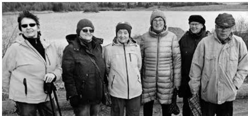
Einige Wanderfreunde der Äbler trotzten Wind und Wetter und eröffneten die neue Wandersaison mit einem Fußmarsch nach Gaisweiler.