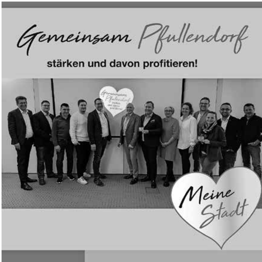
Die Stadt Pfullendorf lädt künftig alle Händler, Gastronomen und Dienstleister zu einem regelmäßigen Austausch beim Stammtisch Handel ein.