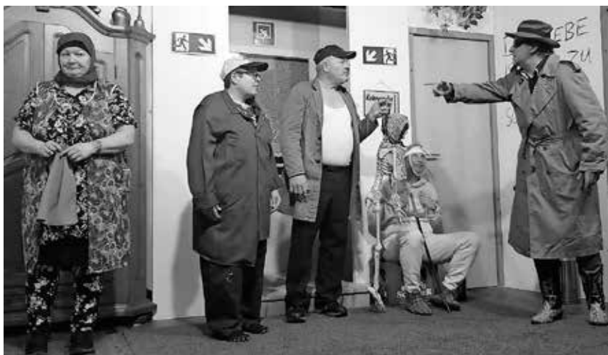
Das Linzgau Theater bringt in dieser Woche die Komödie „Tür an Tür mit Alike“ auf die Bühne im Saal des Gasthauses „Hirsch“ in Hausen am Andelsbach. Karten gibt es beim Bürgerbüro und bei der Sparkasse sowie an der Abendkasse.

tags auch mit Kaffee und Kuchen. Karten im Vorverkauf zu zwölf Euro gibt es ab sofort beim Bürgerbüro, bei der Sparkasse und in Hausen am Andelsbach bei der Bäckerei Birkof. Wie immer spendet das Linzgau Theater den Erlös für einen guten Zweck. Er ist in diesem Jahr für die Pfullendorfer Tafel bestimmt.