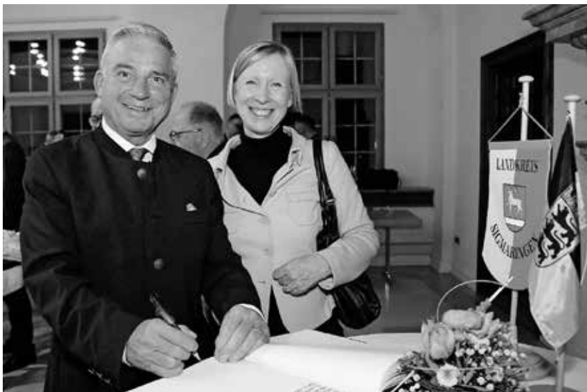
Landrätin Stefanie Bürkle bat Innenminister Thomas Strobl im Rahmen des Festakts zum 50-jährigen Bestehen des Landkreises Sigmaringen um einen Eintrag in das Goldene Buch des Landkreises.

Sigmaringen/pa - Die Kreisabfallwirtschaft teilt mit, dass die Entsorgungsanlage in Ringenbach über die Sommermonate ihre Öffnungszeiten erweitert hat. Bis 31. Oktober öffnet die Deponie samstags bereits um 8 Uhr. Die Öffnungszeiten sind montags von 8.30 bis 12 Uhr und von 13 bis 16.30 Uhr, dienstags bis donnerstags von 8 bis 12 Uhr und von 13.16.30 Uhr, freitags von 8 bis 12 Uhr und von 13 bis 17 Uhr und samstags von 8 bis 12 Uhr. Letzter Einlass ist vormittags und nachmittags