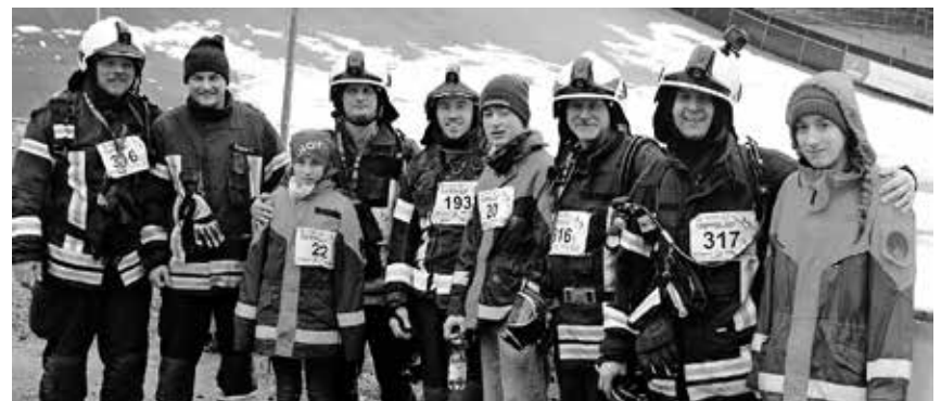
Eine Gruppe von Feuerwehrleuten und Mitglieder der Jugendfeuerwehr traten mit großem Erfolg beim internationalen Treppenlauf der Feuerwehr in Oberhof an.