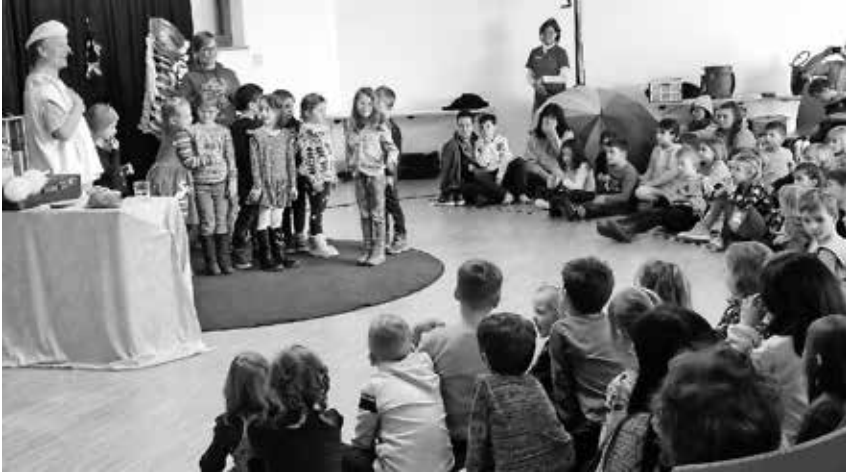
Die Vorschulkinder erlebten ein unterhaltsames Mitmachtheater mit Mausini.

am Ende hell begeistert, als es hieß, dass bald wieder ein Filmmachmittag für sie stattfindet.