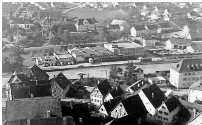
Der letzte Vortrag der Vortragsreihe zur Geschichte der Stadt Pfullendorf beschäftigt sich mit der Zeit von 1803 bis heute. In diese Zeit fällt auch die Ansiedlung der Firma Geberit, die ihren Sitz zunächst am Bahngelände hatte.

ber betrachtet unter dem Thema „Vom badischen Armenhaus zum Wirtschaftszentrum im Linzgau“ die Pfullendorfer Stadtgeschichte vom Jahr 1803 bis zur Gegenwart. Im Vordergrund stehen die bislang noch kaum erforschte Wirtschafts- und Sozialgeschichte des Amts- und Ackerbürgerstädtchens im 19. und 20. Jahrhundert und dessen bemerkenswerter Aufstieg zu einem regionalen Wirtschaftszentrum seit den 1950-er Jahren. Im Unterschied