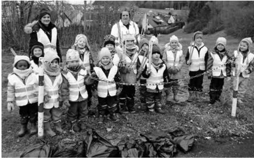
Die Kinder vom Familienzentrum Sonnenschein beteiligten sich mit großem Eifer an der Stadtputzete.

Sigmaringen/pa - Der Caritasverband Sigmaringen lädt Eltern in Trennungs- und Scheidungssituationen zu einem neuen Online-Kurs „Kinder im Blick“ mit dem Thema „Eltern sein und Eltern bleiben“ ein. Der Kurs startet am 17. April und umfasst sechs Abende jeweils von 17.30 bis 20 Uhr. Der Kurs „Kinder im Blick“ ist für Eltern entwickelt worden, die in einer Trennungs- oder Scheidungssituation leben. Trennung und Scheidung sind für alle Beteiligten eine Situation, die mit vielen Umbrüchen und Neuerungen verbunden ist. Kinder leiden darunter, dass die Eltern nicht mehr zusammen sind und wünschen sich die Familie zurück. Umso wichtiger ist hierbei, dass die Kinder wissen, dass ihre Eltern kein Paar mehr sind, aber Eltern bleiben und für sie da sind. Der Kurs basiert auf wissenschaftlichen Erkenntnissen und beinhaltet etliche praktische Einheiten und Alltags-