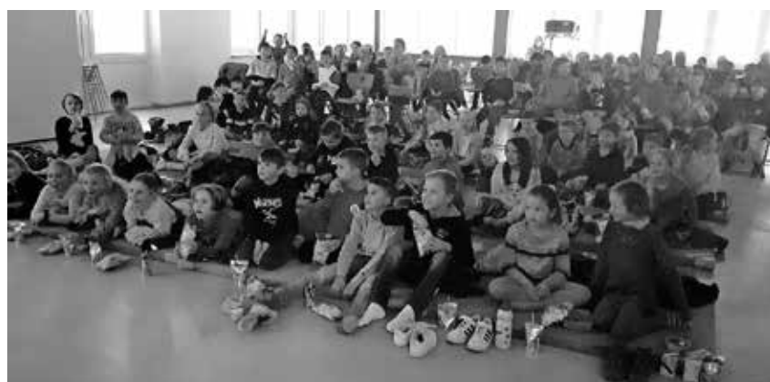
Die jungen Kunden der Sparkasse erlebten einen tollen Filmnachmittag.

Pfullendorf/pa - Die Sparkasse Pfullendorf-Meßkirch hat ihre jungen Kunden wieder zu einem Kinonachmittag eingeladen. Räuber Hotzenplotz stand im Mittelpunkt des Geschehens, denn er hat Großmutterns Kaffeemühle gestohlen. Ein Glück, dass sich Kasperl und Seppl der Sache annehmen. Rund 300 Kinder im Alter von sechs bis zehn Jahren fieberten im gesamten Geschäftsgebiet mit dem Kasperl und waren