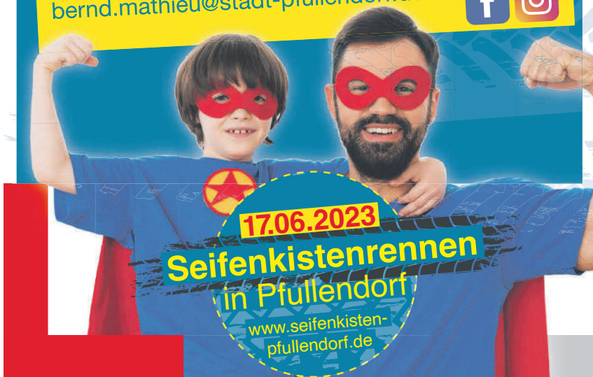
Die Stadt Pfullendorf verlost für das Seifenkistenrennen am 17. Juni eine Seifenkiste. Interessierte reichen ein kleines Video ein, mit dem sie erklären, warum sie mit der Seifenkiste an den Start gehen wollen.