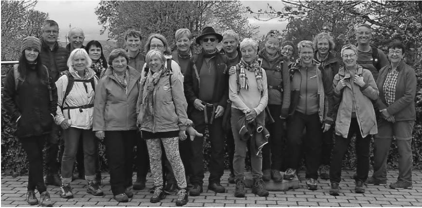
Die Wanderfreunde des DAV waren bei der diesjährigen Maiwanderung rund um Heiligenberg unterwegs.