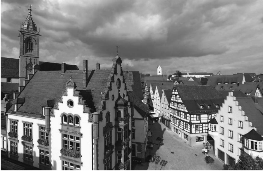
Die Tourist-Information lädt am 4. Juni zu einer historischen Stadtführung ein.

geschlossen. Die anderen Öffnungszeiten von Montag bis Freitag bleiben davon unberührt. Die Bearbeitung sämtlicher Anliegen an allen drei Standorten ist vorläufig nur mit Terminvereinbarung möglich. Das gilt auch für Außerbetriebsetzungen, Kurzzeitkennzeichen, Ausfuhrkennzeichen und Neusiegelungen. Die Kunden der Zulassungsstellen werden um Beachtung und Verständnis gebeten. Trotz intensiver Schulungen des Personals können gerade in der Anfangszeit mit der neuen Software längere Wartezeiten entstehen. Nach der erfolgreichen Umstellung kehren die Zulassungsstellen so schnell wie möglich zum gewohnten Betrieb und den bisherigen Öffnungszeiten zurück.