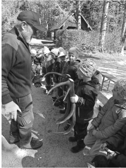
Die großen Kinder des Montessori Kinderhauses erlebten eine aufregende und lehrreiche Waldwoche in Sahlenbach.