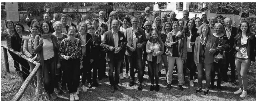
Die Leader-Aktionsgruppen Mittleres Oberschwaben und Württembergisches Allgäu haben zu einem Ausflug eingeladen. Die rund 60 Teilnehmer besuchten Projekte, die von Leader finanziell gefördert wurden.

Dienstags und samstags, 7 - 12 Uhr Marktplatz, Wochenmarkt