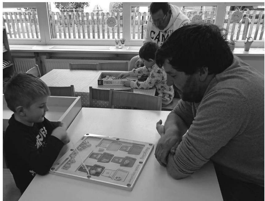
Bei der Papa-Aktion im Denkinger Kindergarten gaben die Kinder ihren Vätern einen Einblick in den Kindergartenalltag.

eines Heims möglich. Die Gastfamilien erleben die Unterstützung und Betreuung ihrer Bewohner als bereichernde und zufriedenstellende Tätigkeit. Die Gastfamilien werden fachlich begleitet und haben einen zuverlässigen Ansprechpartner. Informationen gibt es unter Telefon 0751/3665580, E-Mail: info@arkade-ev.de oder auf der Homepage: www.arkade-ev.de.