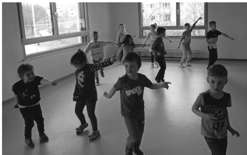
Die Kinder im Familienzentrum Sonnenschein nahmen mit Begeisterung am Tanzprojekt teil.

Sigmaringen/pa - Der Landkreis Sigmaringen hat eine Online-Freizeitkarte für Familien erstellt. Sie enthält von Spielplätzen und Grillstellen bis zu sehenswerten Orten jede Menge Ideen für Kinder, Jugendliche und die ganze Familie. Gefertigt wurde die Familienfreizeitkarte von der Kinder- und Jugendagentur, die in mühevoller Kleinarbeit die Orte eingearbeitet hat. Auch Höhlen, Skate-Anlagen und Pumptracks sind auf diese Weise zu finden. Zu finden ist die Familienfreizeitkarte im Internet: www.landkreis-sigmaringen.de/familienfreizeitkarte . Ergänzt wird sie durch viele weitere Freizeitangebote unter www.landkreis-sigmaringen.de/ferien-daheim . Hier gibt es für Familien eine ganze Fülle an Ideen. Weitere Freizeitziele aufzunehmen und bereits überholte Angebote