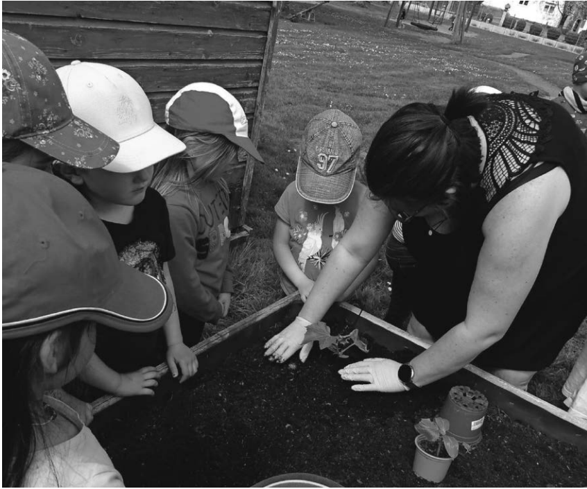
Die Kinder im Denkinger Kindergarten haben Setzlinge gepflanzt und freuen sich auf eigenes frisches Gemüse.

und Gurken gewünscht. Inzwischen sind die herangezogenen Setzlinge in das Hochbeet umgezogen. Die Kinder halfen fleißig beim Einpflanzen. Nun müssen die Setzlinge gegossen und von Sonnenstrahlen gewärmt werden, damit die Kinder das Gemüse schon bald ernten und genießen können.