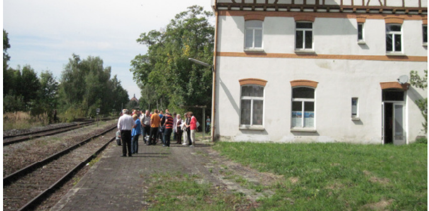
Bahnsteig und das DB-Empfangsgebäude des Keilbahnhofs, Blick in Richtung Pfullendorf