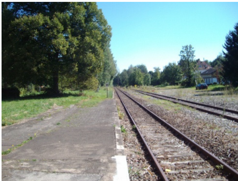
Bahnsteig (Gleis 5), Blick in Richtung Aulendorf

Fotos Bahnhof Altshausen (Stand: Herbst 2010):